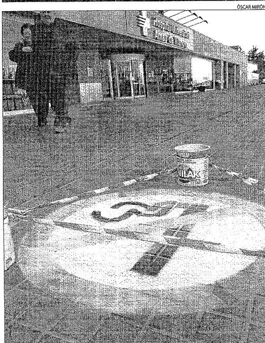
Símbols que prohibeixen fumar pintats prop del recinte de l'Arnau.

BERLÍN | Fins a 144 professors de teologia catòlica d'Alemanya, Àustria i Suïssa han subscrit un manifest en què exigeixen profundes reformes de l'Església Catòlica, que inclouen, entre altres, el final del celibat, el sacerdoci femení i la participació popular en l'elecció de bisbes. La iniciativa suposa el més important alçament contra la cúpula de l'Església Catòlica des de fa 22 anys.