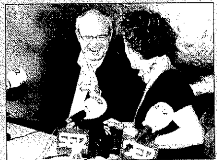
Montilla visitó Alguaire a primera hora de la mañana

Así se explicó José Montilla en la entrevista concedida ayer por la mañana al programa 'A vivir que son dos días', de la Cadena Ser, que emitió su magazine en directo desde el recién estrenado aeropuerto de Lleida. Montilla explicó que, pese a tratarse de un aeropuerto modesto y con pocos destinos, poco a poco se irán in-