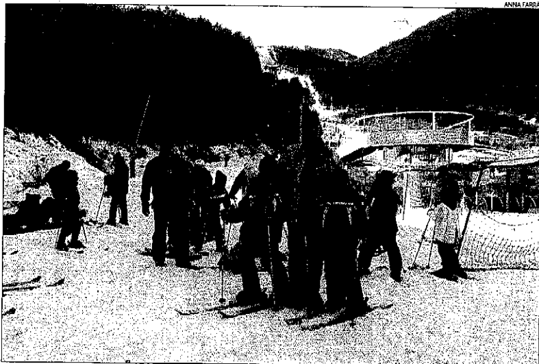
Les pistes d'Espot Esquí, al Sobirà, on es van arribar a registrar més de 7 graus sota zero.