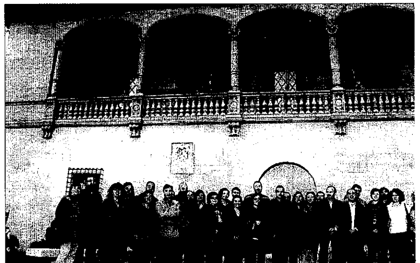
Els lleidatans que van viatjar amb el primer vol a Palma de Mallorca van posar ahir davant del Govern balear.