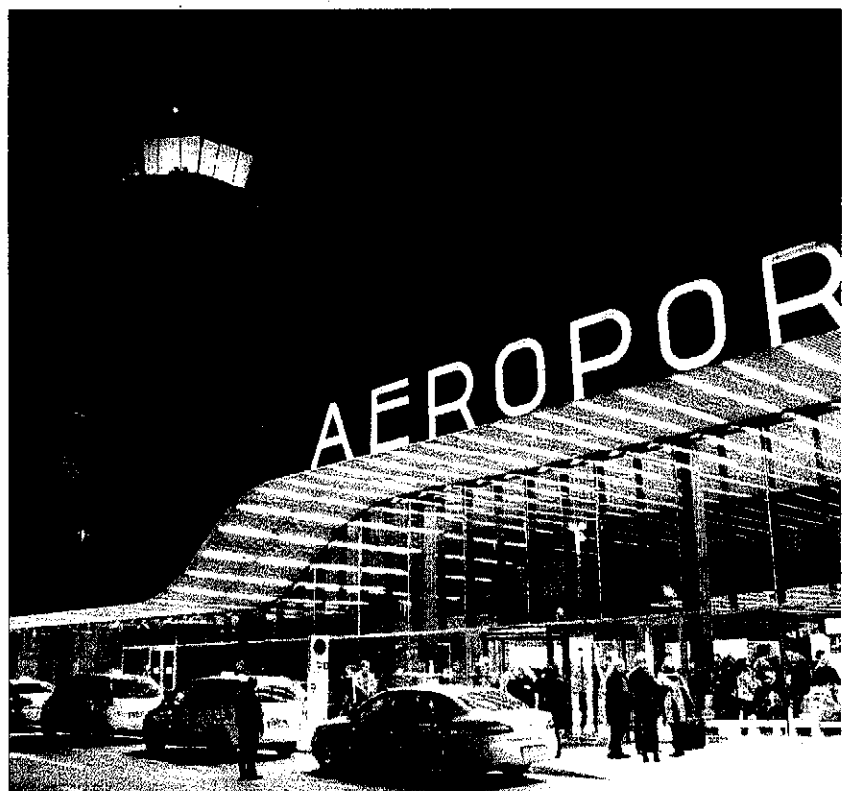
Imatge nocturna de l'aeroport de Lleida-Alguaire, divendres, després de l'enlairament del vol a Palma.

A l'arribar a París, hi havia poca activitat a la terminal d'Orly, cosa que va agilitzar la recollida d'equipatges. Una línia de busos, amb una freqüència d'uns 25 minuts i un preu de 6,40 euros, enllaça amb la xarxa de metro i trens de rodalies. Visitar museus, monuments i edificis, fer compres, acudir a espectacles o admirar la ciutat eren alguns dels plans dels primers viatgers de l'aeroport de Lleida.