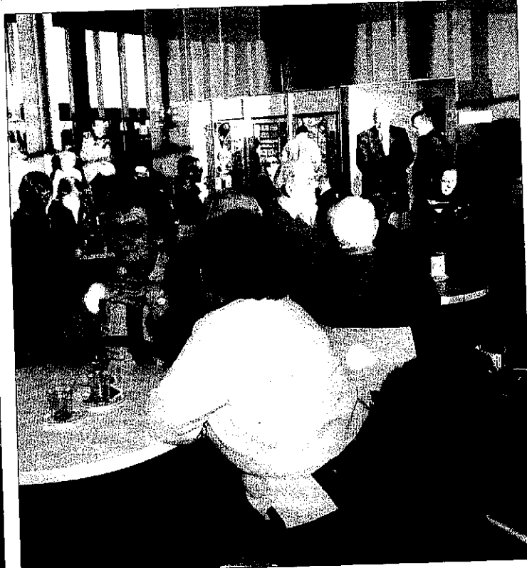
Els passatgers van fer temps prenent un cafè a la cafeteria, que era plena a vessar.