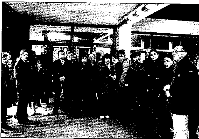
La expedición de las Illes Balears visitó el Centre d'Observació de l'Univers de Àger