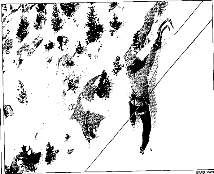
El encuentro de escaladores se realiza hasta hoy domingo en la zona de Cavallers

se está rondando el pleno hotelero gracias a los esquiadores que acuden a la estación del Port del Comte. También están notando positivamente el fin de semana de Carnaval los propietarios de restaurantes de Solsona y cercanías, que prevían llenar todas las mesas disponibles. Mientras los hosteleros de la ciudad sólo lamentan que la gente no haga reservas previas para poder hacer una previsión, los de fuera de Solsona critican que la posibilidad de que los clientes encuentren controles de alcoholemia les hace perder una parte de la clientela. Si hoteles y restaurantes tienen casi un pleno este fin de semana, lo mismo ocurre con los campings del Solsonès, con un 100% de ocupación en los bungalows.