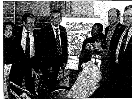
Más de 1.300 niños presentaron su propuesta de cartel

Así lo anunció ayer el alcalde de Lleida, Àngel Ros, que explicó que las instituciones que participan en el salón