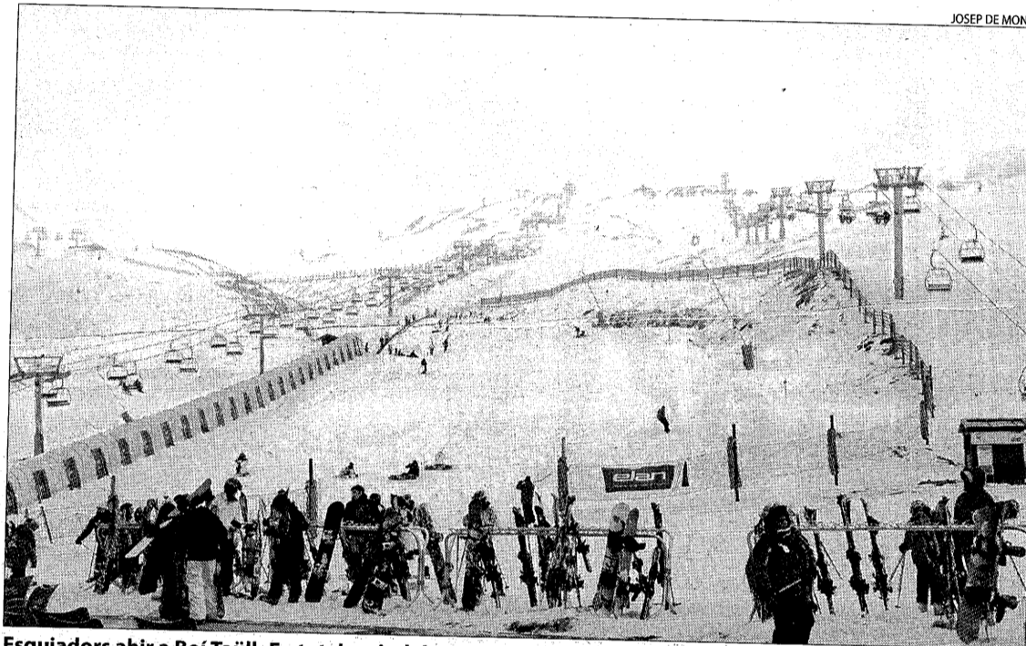
Esquiadors ahir a Boí Taüll. En total, gairebé 60.000 aficionats han esquiat a Lleida en tres dies.

En un altre ordre de coses, el secretari de la Federació de Ta-