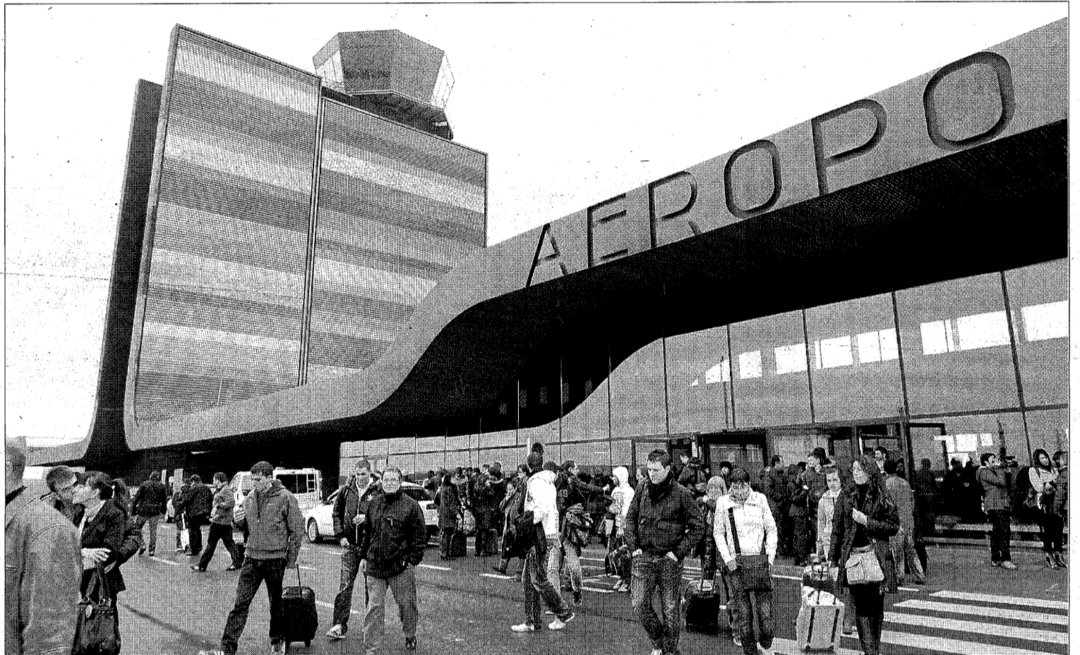
Viatgers procedents de Bèrgam. Molts van viatjar a Alguaire com a única ruta alternativa per tornar a casa, a Barcelona o Madrid.