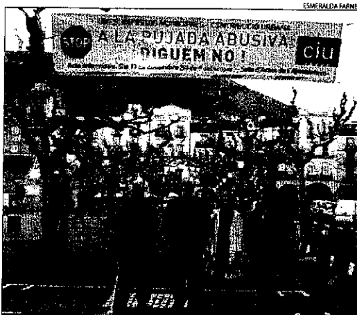
Regidors de CiU sota el cartell col·locat a la plaça del Mercadal.