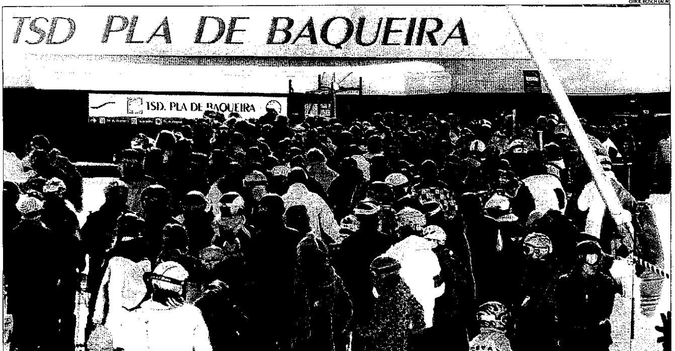
Primeres cues a Baqueira. L'estació aranesa va rebre ahir uns 8.000 esquiadors, més de la meitat del total a les pistes lleidatanes. A la imatge, cues a l'accés al complex.

nint en compte que prop de la meitat de les pistes lleidatanes encara no han pogut obrir per falta de neu. Amb l'obertura ahir de Tavascan i Espot Esquí, tots els dominis esquiables lleidatans han iniciat la temporada coincidint amb el pont festiu.