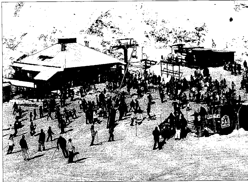
TRETZE MIL ESQUIADORS ESTRENEN LA TEMPORADA AL PIRINEU LLEIDATÀ