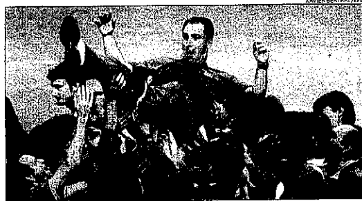
Albert Costa, primer espanyol que guanya la Davis com a jugador i capità