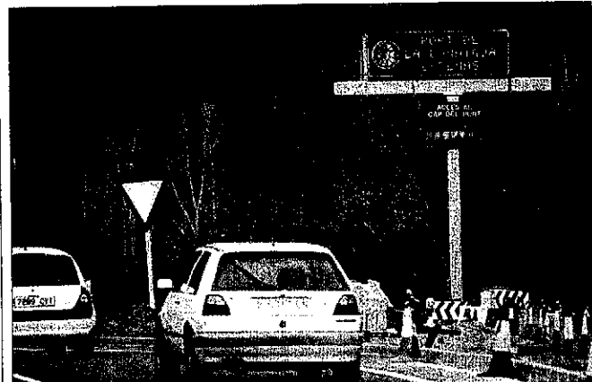
Boí Taüll (esquerra) i Port-Ainé (dreta) són dos de les estacions que van iniciar la temporada d'esquí. La neu va obligar a usar cadenes al port de la Bonaigua.