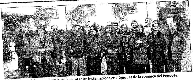
Foto de família dels empresaris que van visitar les instal·lacions enològiques de la comarca del Penedès.