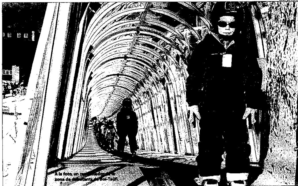
A la foto, un zona de estancament a l'Estació de Turisme.