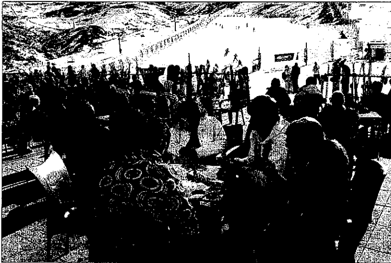
Esquiadors ahir a la terrassa de l'estació d'esquí de Boí Taüll.