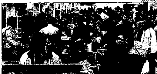
Molts lleidatans van aprofitar el pont per anar de compres.