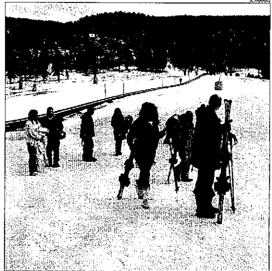
Esquiadors ahir a l'estació de Port-Ainé.