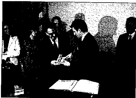
El alcalde de Lleida se reunió con el ministro de Economía

López destacó el papel que tendrá el aeropuerto en la dinamización del Pirineo y restó importancia al nombre de la infraestructura resaltando su valor "lleve el nombre que lleve". Asimismo, el ministro dijo que Andorra "seguirá apostando para fortalecer los lazos y las interrelaciones con la Generalitat de Ca-