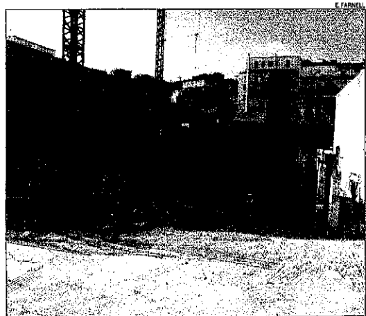
Les obres de l'hospital lleuger de Balaguer.

D'altra banda, la Generalitat va aprovar ahir els estatuts de l'Agència Catalana de Turisme, que funcionarà l'1 de gener i substituirà el consorci de Turisme de Catalunya. L'agència renovarà la gestió de la promoció turística de Catalunya i, amb aquesta finalitat, comptarà amb el sector privat, a través del consell de cambres, que tindrà pes en la presa de decisions i en el finançament.