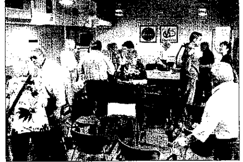
Els veïns de Pardinyes van celebrar ahir l'assemblea.