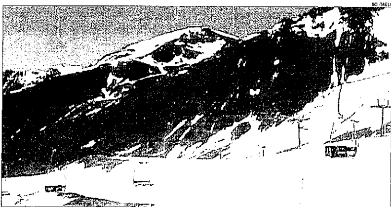
Les instal·lacions de Boí-Taüll a la cota 2.250 ja reflecteixen l'estat de les pistes.

Les altes temperatures també han obligat a suspendre el maxi descens popular, una cursa d'esquí i snowboard oberta a tots els públics, a Vallnord-Arinsal, a Andorra, ja que les con-