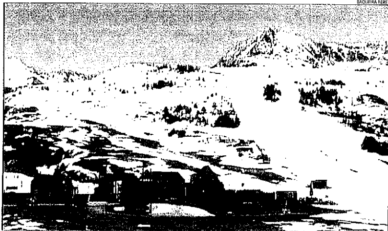
La zona de Beret, ahir al matí, també és un reflex de les altes temperatures.