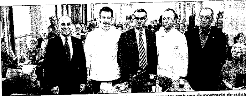
Gilabert va anar a la tarda a la Diada de Lleida a Barcelona, que va comptar amb una demostració de cuina.

Entre les novetats d'aquest any destaca l'Espai Macià de les Borges Blanques, un producte vinculat a la memòria històrica que en el futur es complementarà amb el centre d'interpretació de Tornabous, dedicat a la figura de Lluís Companys. També hi ha les rutes dels Castells, el