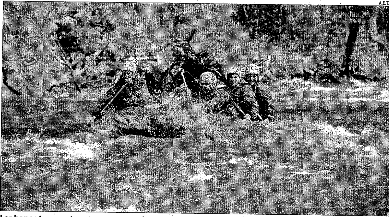
Les bones temperatures van permetre les activitats al riu al matí i a la tarda.

Segons els responsables dels complexos, no és una mala xifra per a primers d'abril, tenint en compte que són els últims dies de la temporada a l'espera del colofó final que pugui ser Setmana Santa. Només Baqueira, Boí i Port Ainé garanteixen arribar fins a les vacances de Pasqua.