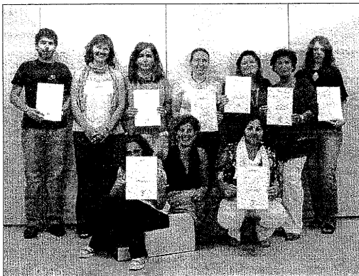
Alguns dels alumnes del curs de teatre, amb el diploma.

societat responsable del projecte, a qui instaran a reprendre'n els treballs de desmantellament, que van quedar aturats fa mesos.