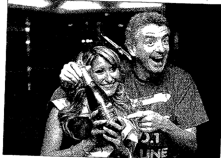
Michael O'Leary, durante la rueda de prensa de ayer

El presidente de Ryanair hizo estas declaraciones en