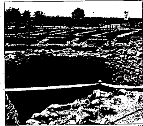
El Vilars y las 'cabanes de volta', grandes atractivos

ser otra opción para atraer visitantes. También el futuro Espai Macià de les Borges se constituye como una nueva oferta cultural en la ciudad.