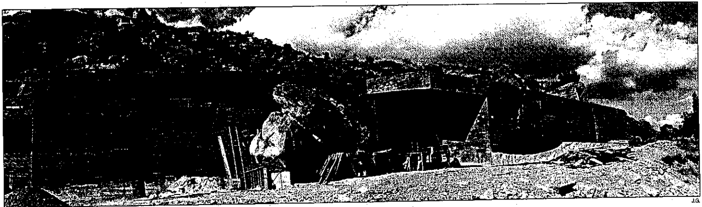
El edificio del Centre d'Interpretació de l'Art Rupestre del Cogul está a punto de acabarse y próximamente se deberá preparar el proyecto museístico

Todo se encamina para que la comarca pueda convertirse en un nuevo destino turístico con un amplia abanico de posibilidades.