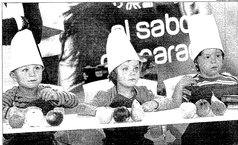
El saló Produqte va acollir ahir un taller d'alimentació amb fruita per a nens.