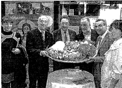
Un moment de la presentació, ahir a la Fira de Sant Miquel.