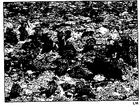
Los buitres acudían al vertedero de Figols a comer

Por otra parte, entre los puntos débiles, destaca que predominan los establecimientos de categoría baja "cuando la tendencia es a buscar una categoría más alta", explicó Casanovas que también añadió que el grado de ocupación hotelera es bajo.