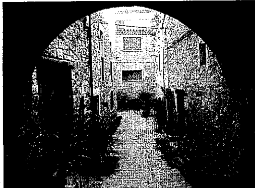
Guimerà es podria adaptar a les bases de Pobles amb Encant.

Així mateix, el Patronat de Turisme ha publicat les bases per a la xarxa de Pobles amb Encant. Aquesta convocatòria està oberta als municipis, nuclis i entitats descentralitzades de fins a 1.000 habitants i té com a objectiu la creació d'un catàleg de localitats que destaquin per la seua bellesa, patrimoni o tradicions. Les subvencions, que compten amb un import