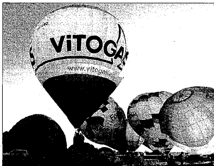
Una gran cantidad de globos se han concentrado estos días en Mollerussa

Además de la competición, el evento ha colaborado con el proyecto social Realiza tu sueño, en el que dos niños cumplieron su sueño de poder volar un rato en globo aerostático.