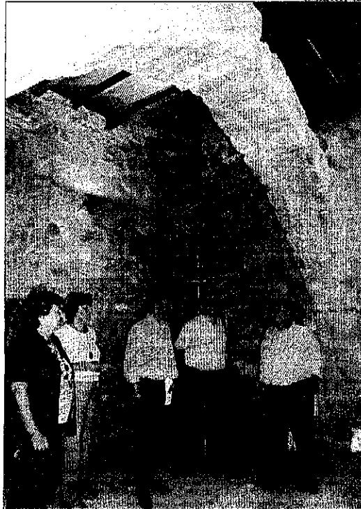
La sala habilitada per al marquès al castell de Ciutadilla.

El consell també va obtindre la cessió del castell de Maldà en virtut a un conveni similar al de Ciutadilla, que també contempla l'obligació d'habilitar en el