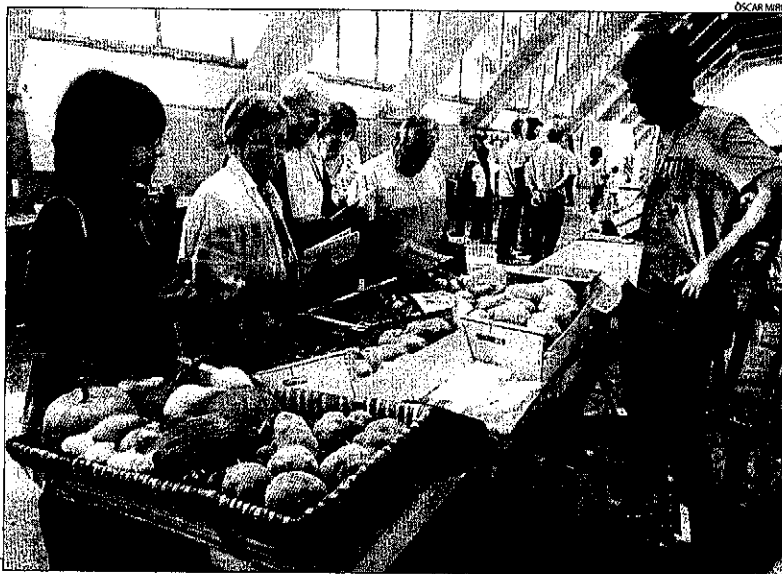
Alguns dels expositors venien productes ecològics de l'horta.

■ La filla de Félix Rodríguez de la Fuente va inaugurar ahir Slowlleida, fira en què es poden trobar un vi valorat per Parker amb 93 punts i també ratafia de cafè, entre d'altres.