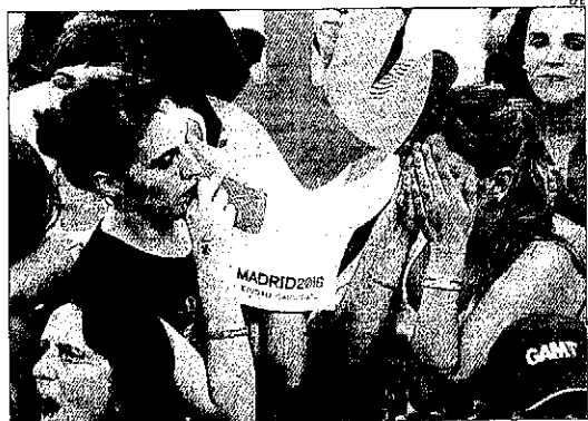
Madrid va viure, primer amb nervis i amb desolació després, la votació.