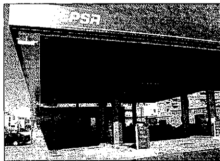
Una de las gasolineras atracadas el año pasado