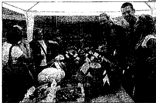
Una dels parades de la Fira del Rovelló de Coll de Nargó.

LA SEU/TREMP | La frontera andorrana va registrar ahir al migdia cues que van superar els 10 quilòmetres a la carretera N-145, que comunica la Seu amb el Principat. També hi va haver retencions de trànsit a les travessies de diferents localitats de l'Ait Urgell, com Oliana i Coll de Nargó, el primer dia del pont festiu del 12 d'octubre, en què les comarques del Pirineu han arribat a una ocupació d'entre el 80% i el 85% de les places d'allotjament. S'ha de destacar que, en aquestes dates, l'oferta hotelera és un 60% del total, ja que nombrosos establiments estan tancats. L'afluència de turis-