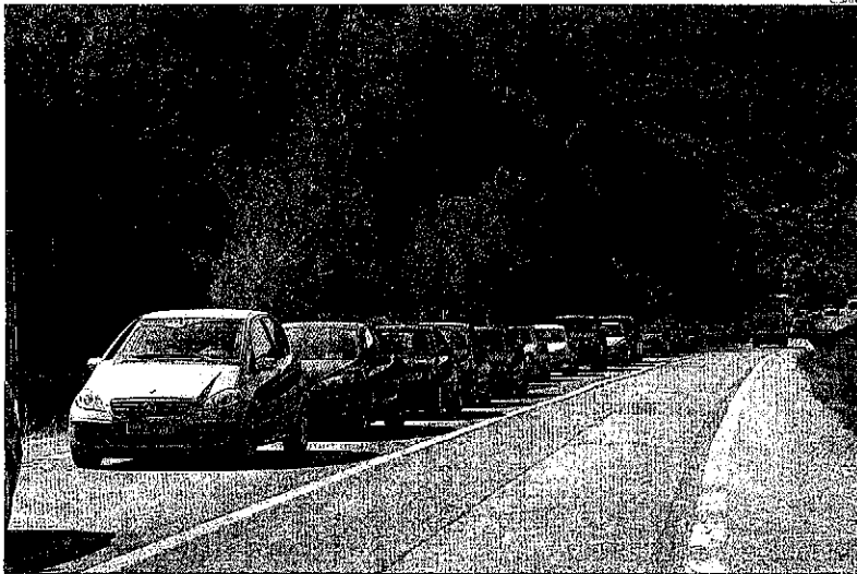
Les cues per accedir a Andorra van arribar als 10 quilòmetres.