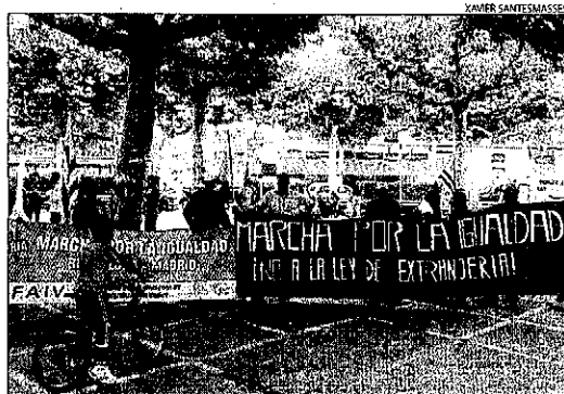
Una quinzena d'immigrants es van manifestar ahir a Tàrraga.