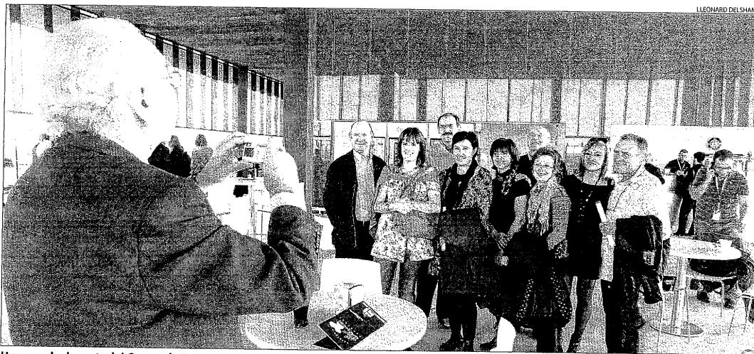
Un grup de docents del Centre de Recursos Pedagògics del Segrià es fotografien a l'aeroport abans d'agafar el vol a Barcelona.

Fins al 15 de gener, després de constatar l'escassetat de reserves per al pont aeri, inaugurat ahir amb nomé cinc viatgers de pagament || El Govern espera arribar a 30 persones per avió al gener i a cent en un any