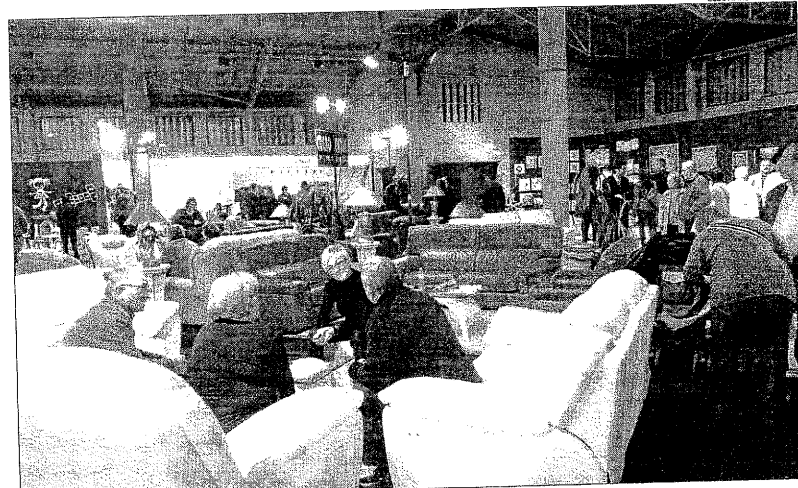
Decorhàbitat compta amb 45 expositors dedicats al mobiliari, la decoració i l'interiorisme.