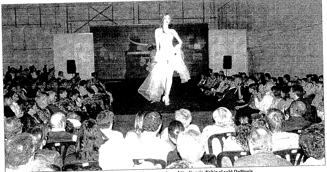
La desfilada de vestits de núvia i de roba interior va ser un dels actes més multitudinaris d'ahir al saló DeNuvis.

Abans de la desfilada, Sara Buirra Estètica i Hairstudio by Dani van oferir exhibicions de maquillatge i perruqueria.