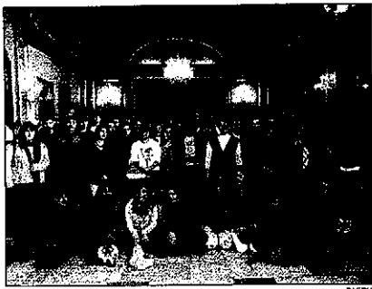
Los 24 estudiantes viven con familias leridanas