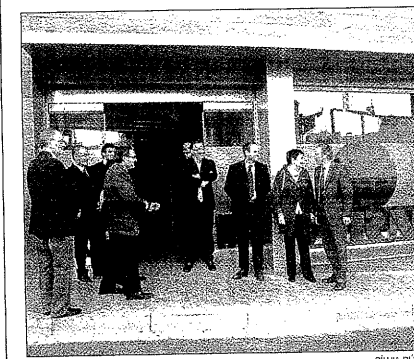
Estreno de la nueva sede de Benito Arnó

mobiliario urbano. En este sentido, la actuación en este solar público, ha consistido en la realización de una jardinería central de grandes dimensiones hecha de piedra, donde se han plantado tres arbustos y 515 plantas arbustivas. Además, se han plantado un total de 9 árboles a lo largo de todo el perímetro de la zona.