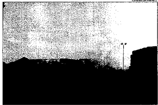
L'incendi de Vallfogona continuava ahir actiu.