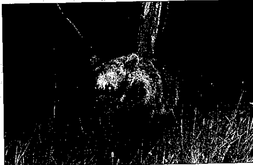
Imatge d'un ós el passat mes de juliol al municipi d'Alt Àneu.

El departament de Medi Ambient va indicar que, a més de seguir l'ós, aquests equips verificaran els danys a bestiar i rus-