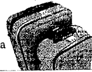
El turista israelià visita cada cop més les comarques de Lleida

El turisme israelià s'ha disparat a Lleida en els últims anys fins a convertir-se, amb 6.000 visitants a l'any, en el cinquè col·lectiu d'estrangers que es desplacen a les comarques de Ponent, especialment al Pirineu per disfrutar de la seua oferta ambiental, cultural i natural. Molts establiments de les zones de muntanya estan adaptant la seua oferta a aquesta demanda, amb la incorporació, per exemple, de menús traduïts a l'hebreu.