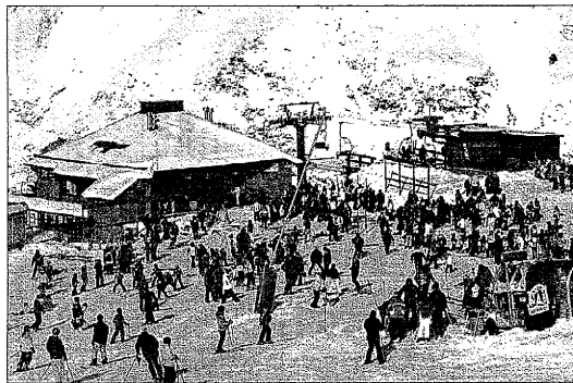
La Val d'Aran y el resto del Pirineo de Lleida han perdido turistas

El número de pernoctaciones respecto al número de visitantes rebela el único dato positivo de la encuesta