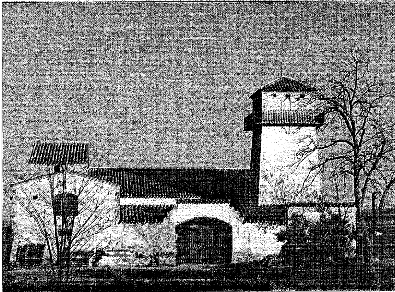
El restaurante La Torre del Nastasi estará situado en la partida de la Caparrella y abrirá dentro de dos años