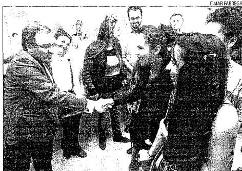
Ros saluda unes usuàries d'aquest centre juvenil de la Mariola.