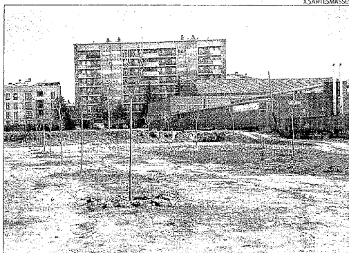
La zona on es preveu instal·lar el càmping de Cervera.

Aquest serà el primer càmping de la capital i també de la comarca de la Segarra, que fa més de dos anys es va plante-