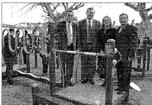
Las instalaciones facilitan el poder hacer ejercicio físico

Este nuevo espacio se trata de un circuito de ejercicios diseñado para trabajar las principales partes del cuerpo con el objetivo de promover la actividad física y los hábitos salu-