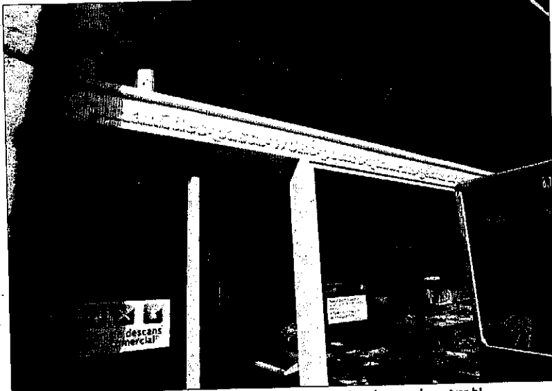
El lladre va forçar la porta de l'establiment, ubicat al carrer Sant Antoni, per poder entrar-hi.

Al veure's perseguit, l'home va llançar la caixa enregistradora contra els agents, que la van esquivar