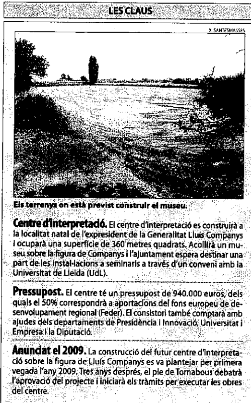
El terreny on està previst construir el museu.

Fa uns mesos, concretament al setembre de l'any passat, el conseller de Governació, Jordi Ausàs, va anunciar la construcció del centre d'interpretació sobre l'expresident Companys. El projecte es completa amb al-