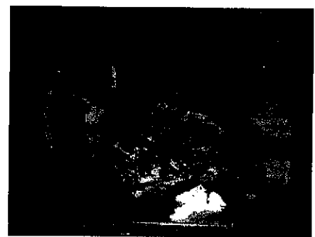
ASSOCIACIÓ L'OM VILALLER

por la Diputació de Lleida y que reunirá a una quincena de profesionales de las oficinas de turismo locales y comarcales de toda Lleida. Bajo el título "Conexiem el Pirineu i les Terres de Lleida" los profesionales del sector expondrán las novedades de cada oficina en una sesión formativa por la mañana en la sede del Consell Comarcal. Por la tarde está prevista una visita al Centre del Romànic de la Vall de Boí y a una de las iglesias románicas declaradas Patrimoni Mundial.