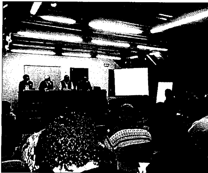
El Patronat Vall de Boí celebró hace unos días asamblea y dio a conocer los proyectos

Entre los temas tratados por la asamblea del Patronat también se presentó el proyecto "Gula't per la Vall de Boí", un sistema de autoguiaje en GPS por los caminos rurales del municipio (propuesta innovadora impulsada desde una oficina de turismo), según la cual el senderista puede, previo paso por la oficina de turismo de la Vall, alquilar