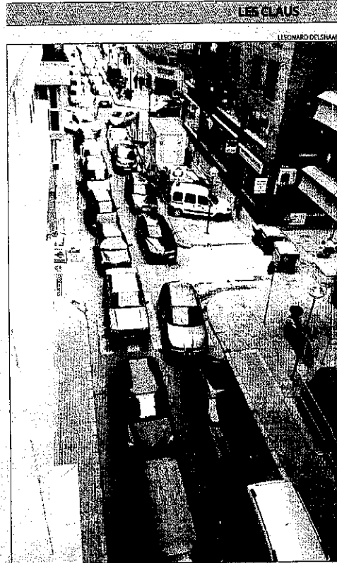
El carrer General Brito va quedar ahir col·lapsat pel trànsit.

L'avinguda del Segre estarà tallada durant unes dos setmanes per poder completar les obres de renovació del col·lector de l'avinguda del Segre.