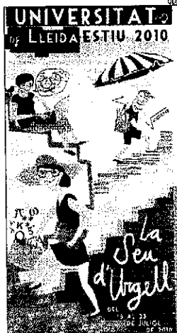
El cartell de la Universitat d'Estiu.